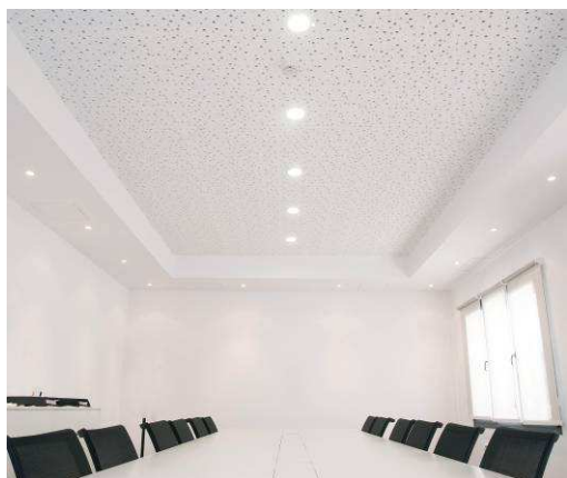
PRÉGYBEL A 8-15-20 N°1 BD13 - DR SINIAT