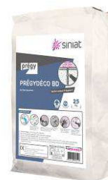
PRÉGYDÉCO BD DE 25 KG - DR SINIAT