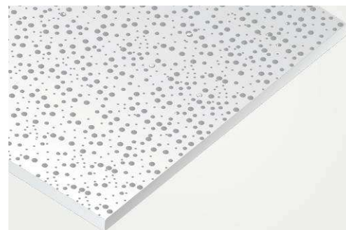
PRÉGYBEL A 8-15-20 N°1 BD13 - DR SINIAT

PRÉGYBEL A 8-15-20 N°1 BD13 et PRÉGYBEL A 12-20-35 N°1 BD13 se caractérisent par des bords droits et des perforations rondes aléatoires . Ces dernières s'étendent jusqu'aux extrémités des plaques, apportant une correction acoustique (respectivement \alpha_w = 0,55 et \alpha_w = 0,50 ) et une esthétique uniforme .