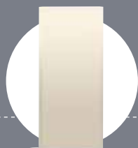
Plaque de plâtre SINIAT