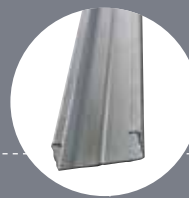
Fourrure PRÉGYMÉTAL S47