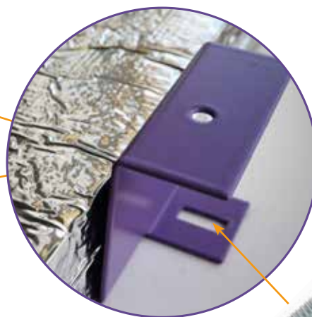
Emplacement du boulon tête plate - Diamètre 6 mm